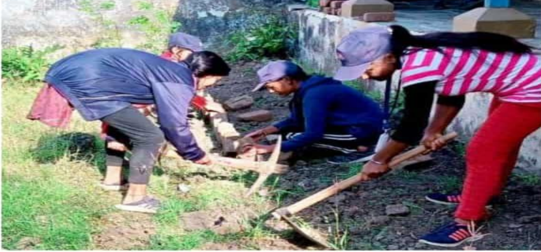
श्रमदान करती छात्राएं