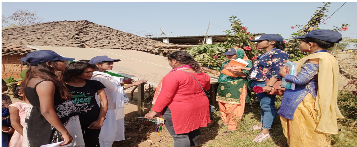
Rain Water Harvesting Tank